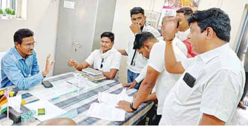
हरिभूमि न्यूज | छिंदवाड़ा